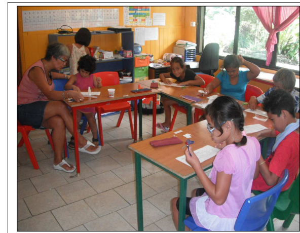
L'unité d'enseignement fait partie intégrante de la PEMS !

La loi du 11 février 2005 et l'arrêté du 2 avril 2009 précisent les modalités d'organisation des unités d'enseignement dans les établissements médico-sociaux. Les éléments de réponse donnés dans cette plaquette en sont issus.